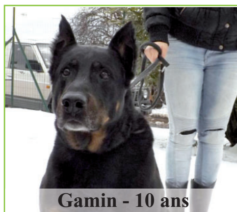
Gamin - 10 ans