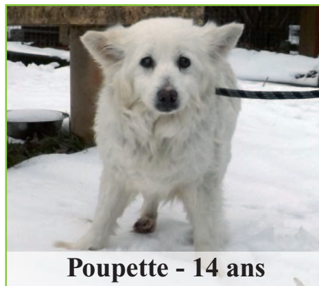
Poupette - 14 ans

Aidez nous à leur trouver un foyer au plus vite !!