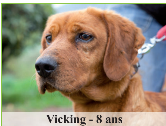
Vicking - 8 ans

Aidez nous à leur trouver un foyer au plus vite !!