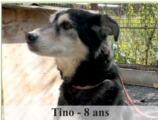
Tino - 8 ans

Voici nos papys et mamie du refuge à placer, ils ont un regard si triste mais pourtant les gens qui viennent adopter ne s'arrêtent pas devant eux.