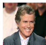
Claude Sérillon journaliste