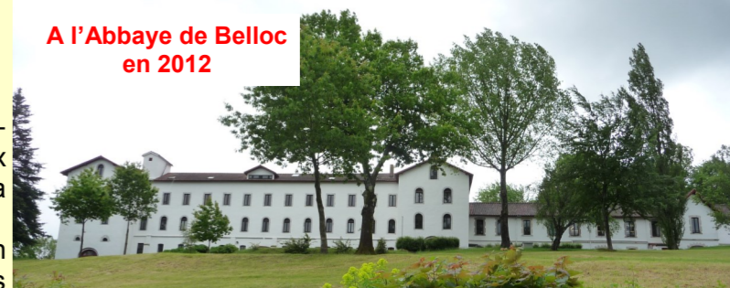
A l'Abbaye de Belloc en 2012

Pour celles et ceux qui ne pourraient assister à cette séance, il est prévu la même projection à 20h30 à la salle paroissiale de Gelos.