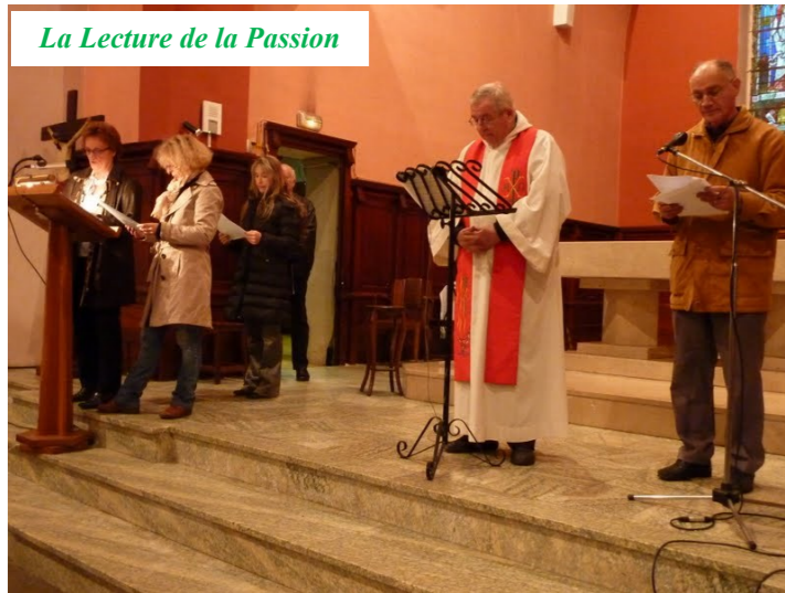
La Lecture de la Passion

Mais la Passion selon St Jean était écoutée avec attention par les membres de l'Assemblée. Puis ce fut la grande prière aux intentions de l'Eglise et l'adoration de la Croix : « Voici le bois de la Croix qui a porté le salut du monde... Victoire tu régneras, O Croix tu nous sauveras ! »