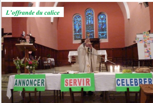
L'offrande du calice

Le JEUDI SAINT , fête de l'institution de l'Eucharistie et du Sacerdoce, a été suivi par une bonne centaine de participants.