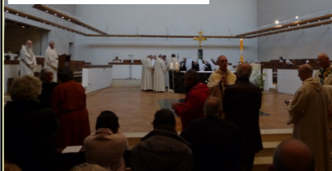
La messe en 2012