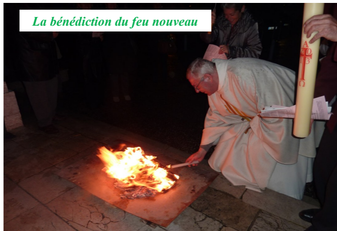
La bénédiction du feu nouveau