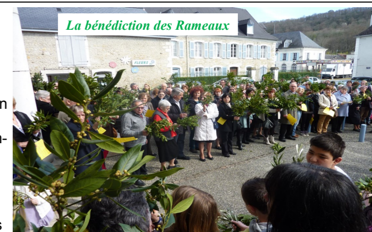
La bénédiction des Rameaux

Les RAMEAUX ont été célébrés à Haut de Gan et Gan : bénédiction des rameaux dehors et proclamation de l'ouverture de la Semaine Sainte. Puis rentrée en procession en chantant : Peuple de Dieu, marche Joyeux... car le Seigneur est avec toi. Puis ce fut la lecture de la Passion entrecoupée de commentaires et de refrains. Et enfin l'Eucharistie. Une foule importante était présente dans les deux églises pour cette célébration traditionnelle..