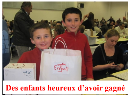
Des enfants heureux d'avoir gagné