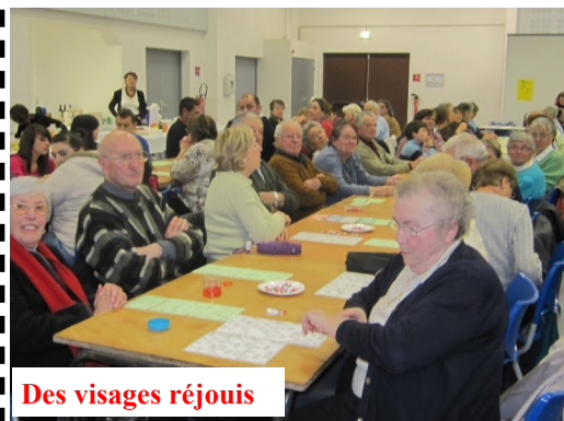
Des visages réjouis