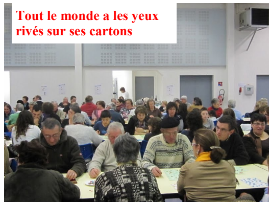
Tout le monde a les yeux ravis sur ses cartons