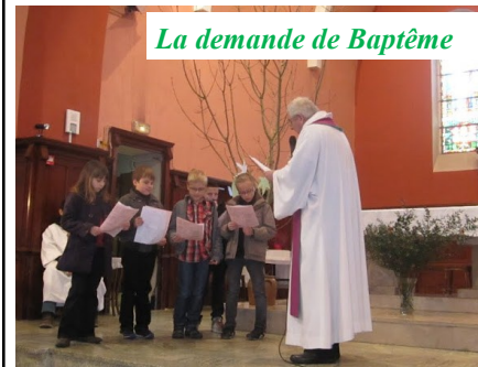
La demande de Baptême