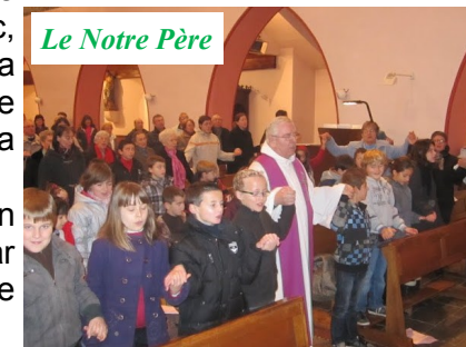
Le Notre Père

Le moment du Notre Père a été un temps très fort de communion entre tous, car cette chaîne que nous avons formée était le signe d'un peuple en marche vers Dieu.