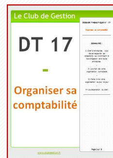
DT 17 – Organiser sa comptabilité