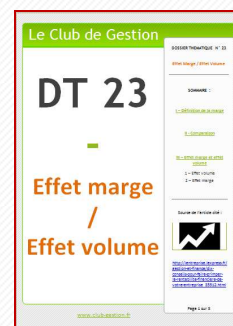
DT 23 – Effet marge / Effet volume