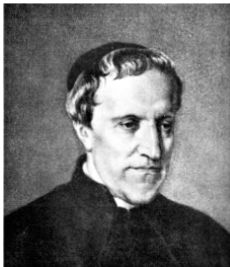
Antonio Rosmini Serbati

La Nota de la Congregación para la Doctrina de la Fe recuerda (a su modo, como veremos) los antecedentes respecto de la «cuestión rosminiana». « El Magisterio de la Iglesia (...) se ha interesado muchas veces durante el siglo XIX en los resultados del trabajo intelectual del Padre Antonio Rosmini Serbati (1797-1855). Puso en el Index dos de sus obras en 1849, después declaró indemne de toda sospecha [el texto original dice: «dimettendo poi dal esame», lo que puede traducirse más correctamente como «retirant de la procédure» en francés, nda. - ndt: en español, «después lo retiró del procedimiento (o proceso)»], por Decreto doctrinal de la Sagrada Congregación del Index, la opera omnia, y más tarde, en 1887, condenó cuarenta proposiciones extraídas de obras en su mayor parte póstumas y de algunas obras publicadas en vida, por Decreto doctrinal de la Sagrada Congregación del Santo Oficio llamado 'Post obitum' (Denz. 3201-3241). Una lectura aproximativa y superficial de estas diversas intervenciones podría