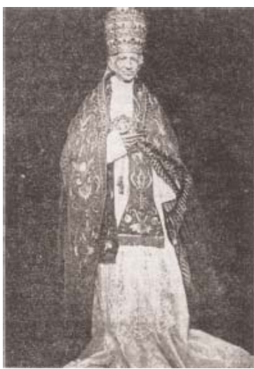
Rosmini fue condenado en 1887, bajo el Papa León XIII