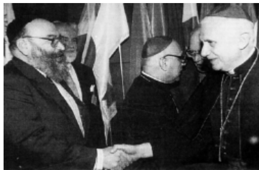
Ratzinger ayer y hoy: fiel ejecutor y continuador del programa ecuménico conciliar y de la línea de Juan Pablo II (febrero de 1994, conferencia internacional judeo-cristiana)

Por eso, cuando dice que « las religiones pueden reconciliarse a nivel de un compromiso común en un proyecto terreno que las superará a todas » o que « nos encontramos juntos para rezar por la paz », me permito poner en duda seriamente de qué paz habla, mucho me temo que no se trata de la paz de Cristo (que ciertamente no se construye a través de reuniones en que los católicos rezan junto con los miembros de otras religiones), y que sí se parece demasiado (por más sofismas que se sostengan) a la paz masónica.