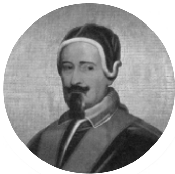
El Papa Alejandro VII condenó «la astuta distinción» de los jansenistas