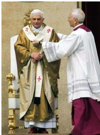
Joseph Ratzinger hoy, como Benedicto XVI

«La Santidad de Nuestro Señor León XIII, Papa por Divina Providencia, el cual tiene en el corazón por encima de todo, que el depósito de la doctrina católica sea conservado puro y exento de error, ha encargado al Sagrado consejo de Muy Eminentes Cardenales, Inquisidores generales en toda la república cristiana, examinar las proposiciones denunciadas. La Suprema Congregación, habiendo pues, como es costumbre, emprendido un examen de los más diligentes y procedido a la confrontación de estas proposiciones con las otras doctrinas del Autor, sobre todo aquellas que se desprenden claramente de los libros póstumos; la Suprema Congregación juzga que deben ser reprobadas, condenadas, según el sentido tomado por el Autor, las proposiciones siguientes que este decreto general [Post obitum] reprueba, condena y proscrib[e] efectivamente: sin por eso ser lícito a nadie deducir que las otras doctrinas del mismo Autor, que no están condenadas por este decreto, sean en manera alguna aprobadas. Después de haber presentado una escrupulosa relación