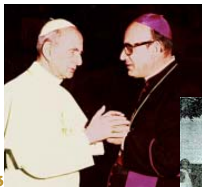
Dos revolucionarios: Angelelli con Pablo VI

Un revolucionario celebrando la «liturgia» revolucionaria de Pablo VI para los revolucionarios Montoneros, cuya bandera cuelga de la pared («Angelelli y Amiratti, foto publicada en 'El Independiente', 1973»)