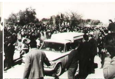
«Yéndose en la camioneta en la que luego se mata»

Claro que eran los tiempos furiosos «pos-concilio», la Iglesia en estado deliberativo.