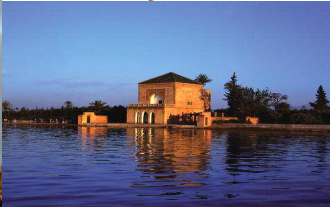
Morocco - Marrakech - The Ménara