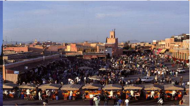
Morocco - Marrakech - Jemaa el Fna Place