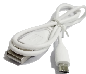
Câble USB fourni

Batterie universelle rechargeable Li-Ion 2200 mAh Sortie continue : USB 5V/0.8A Entrée continue : Micro USB 5V/1A Dimensions: 90 x 32.5 x 21 mm Poids : 75gr Coloris : Vert, bleu, noir, rouge. Marquage : tampographie, sérigraphie Surface de marquage : 40 x 13mm. Conditionnement : Boîte en carton + film bulle + câble usb.