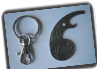
Ref: CREVETTES Fonctions : Jeton caddie et décapsuleur