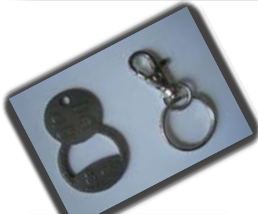
Ref: BUBBLE Fonctions : Jeton caddie et décapsuleur