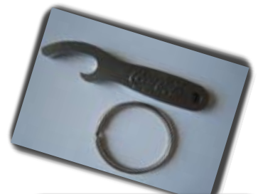
Ref: SEICHE Fonctions : décapsuleur