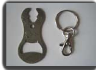
Ref: PIEUVRE Fonctions : Jeton caddie, décapsuleur, clé de 10, Lime à ongles, clé antenne voiture.