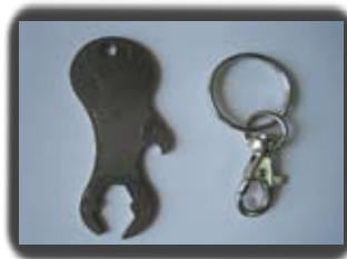
Ref: POISSON Fonctions : Jeton caddie, décapsuleur, clé de 10, Lime à ongles, clé antenne voiture.