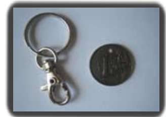
Ref: JETON Fonctions : Jeton caddie