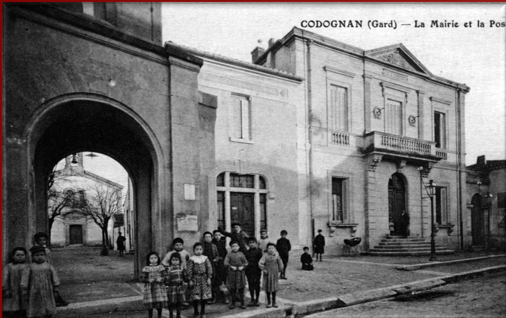
CODOGNAN (Gard) — La Mairie et la Pos