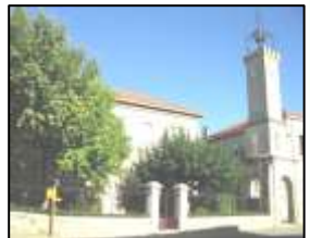
Bibliothèque Pages 4-5