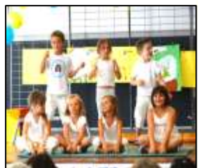
La vie associative Page 8