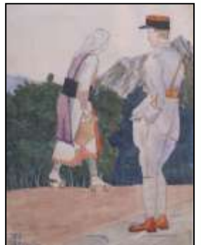
Les Poilus de Codognan Pages 6-7-12