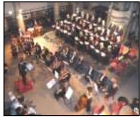
Concert de Noël Page 3

http://www.carrefourculturelcodognanais.fr