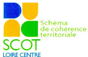
Schéma de Cohérence Territoriale Loire Centre

EVALUATION ENVIRONNEMENTALE DU SCHEMA DE COHERENCE TERRITORIALE LOIRE CENTRE EN COURS D'ELABORATION