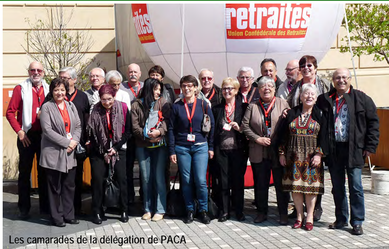
Les camarades de la délégation de PACA

Il y a aussi des questions comme : « Quelles structures d'accueil pour les futurs retraités » ?