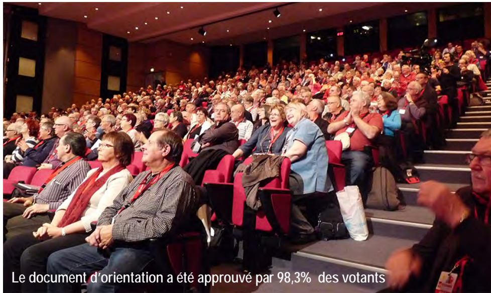
Le document d'orientation a été approuvé par 98,3% des votants

Sans doute faut-il élargir le champ d'activité au-delà des revendications traditionnelles comme le pouvoir d'achat, pour aborder les autres questions qui touchent à la vie des retraités, comme le transport, le