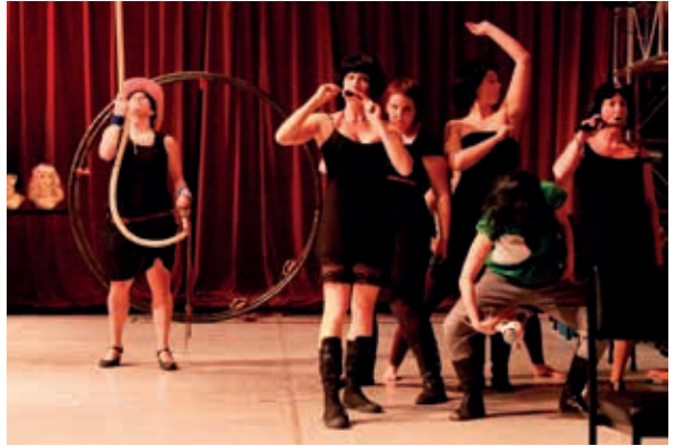
© Cirque de femmes en tout genre