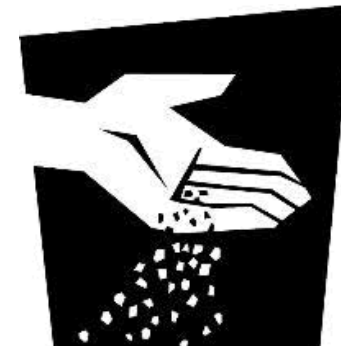
Grain de moutarde

MOUTARDE GRAIN GRANDE SEMER ROYAUME SEMENCE PETITE PARABOLE