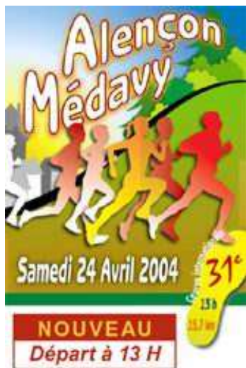
Fred – Médavy 2003