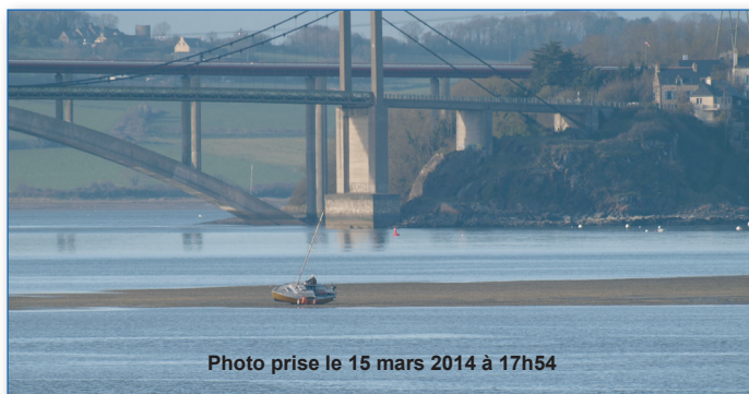
Photo prise le 15 mars 2014 à 17h54

Le 15 mars dernier, un plaisancier en a fait l'expérience. Echoué aux alentours de 13h, il n'a pu repartir qu'après 18h. Leçons à tirer : les fenêtres de navigation sont de plus en plus réduites, pour tirer des bords dans la plaine de Mordreuc, n'embarquez pas sans la courbe de niveau du jour, et sans sondeur.