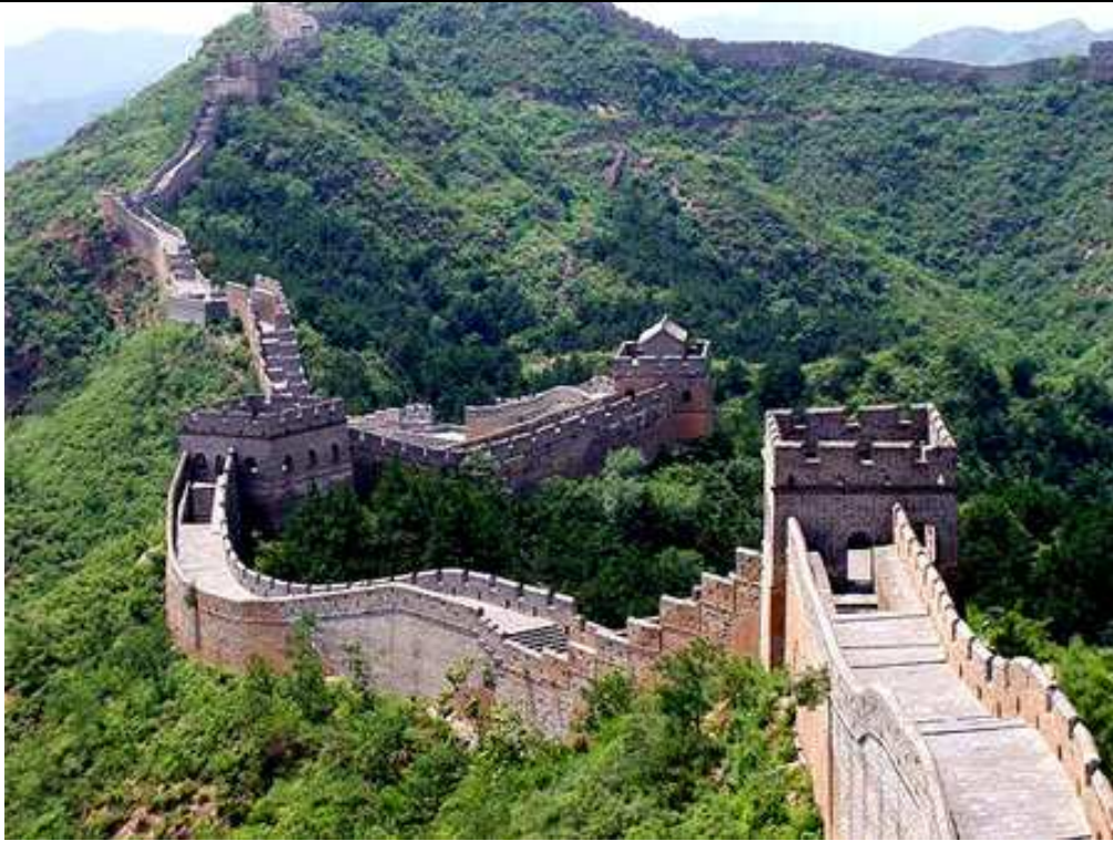
la muraille de Chine