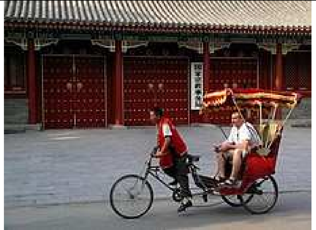
Un pousse- pousse