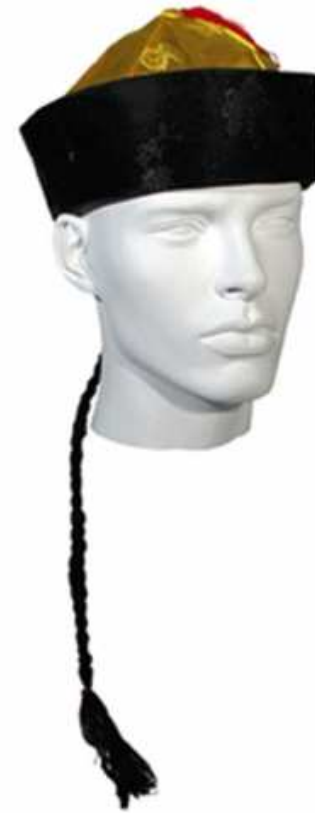
des chapeaux chinois