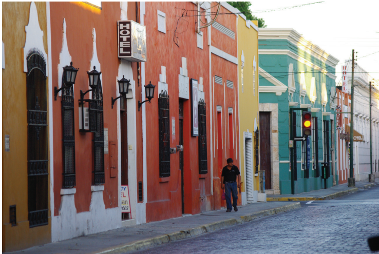
Maisons mexicaines à Merida