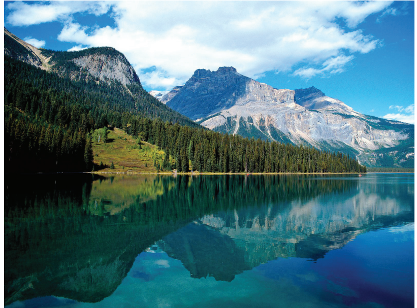
Lac Emerald en Colombie Britannique