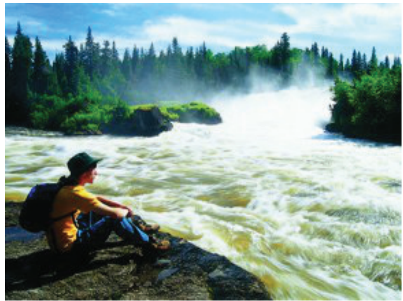
Une rivière au Manitoba