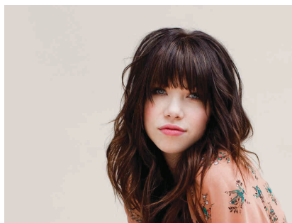
Carly Rae Jepsen