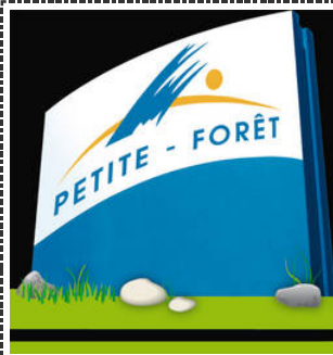
Ville de petite-Forêt

I-1) Modification du Plan Local D'Urbanisme : résultat de l'enquête publique I-2) Proposition de candidats aux postes de commissaires titulaires et de commissaires suppléants