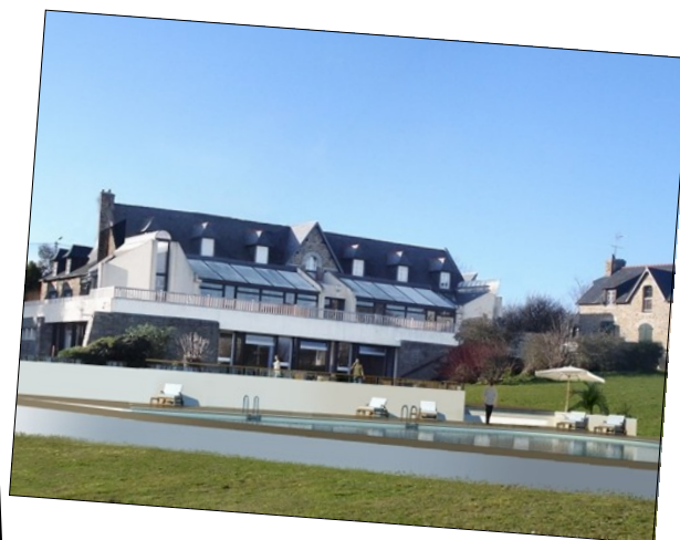
Le village de vacances qui a hébergé le groupe

Les 41 participants au séjour de St Gildas ont effectué un séjour plein de découvertes de cette région avec une météo estivale et en bateau pour voguer puis randonner à Belle-Ile en Mer .....mais Laurent Voulzy absent, ils n'ont pu aller jusqu'à Marie Galante..... !