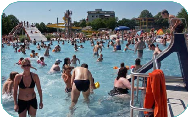
attraktives Nichtschwimmerbecken mit Breitrutsche