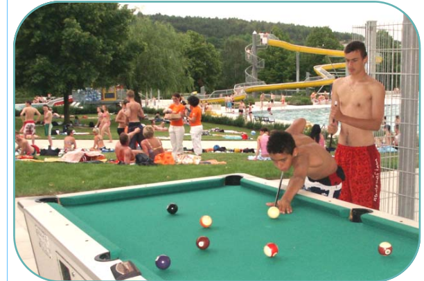
Billardspiel + Tischtennis