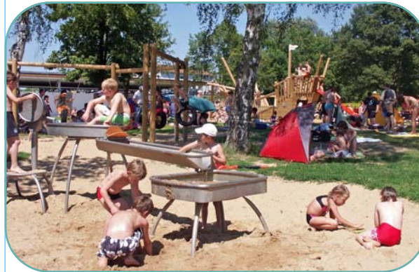
Erlebnis-Kinderspielplatz + Kinderplanschlandschaft