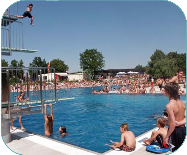
50 m Sport-Becken - Sprungturmanlage