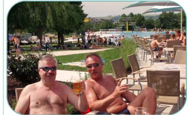
toller Ausblick Kioskterrasse auf Badelandschaft