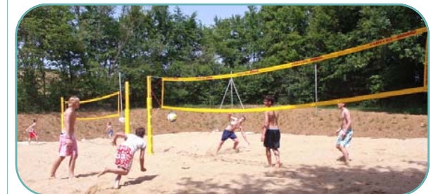
Beachvolleyball + Boccia