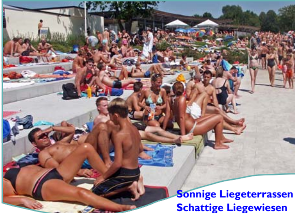
Sonnige Liegeterrassen Schattige Liegewiesen

...eines der schönsten und größten Freibäder weit und breit