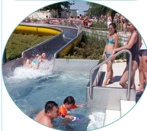
Großrutsche mit Sofaeinlauf