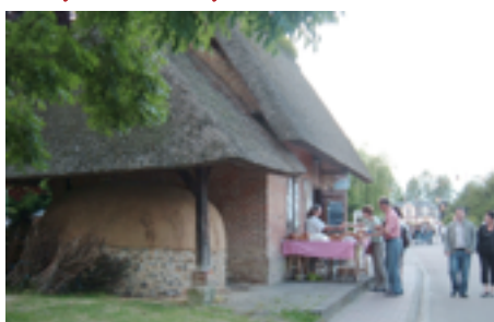
Le Four à pain - Musée