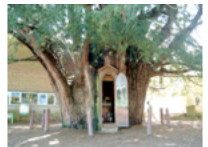
Les 2 Arbres millénaires à chapelles