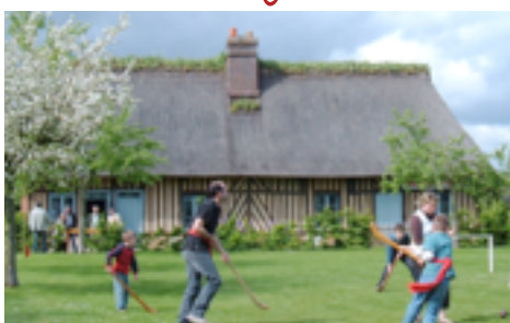
La Chaumière aux Orties - Musée du Sabot

Un joli cadre champêtre pour Orties Folies 2011