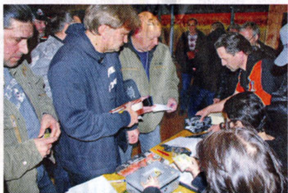
Grosser Andrang. Über 60 Mitglieder trugen sich schon an der Gründungsversammlung ein.