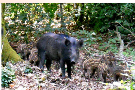
Laie et marcassins. Le pelage des petits leur permet de se confondre presque parfaitement avec l'environnement.

lez ! Monsieur le maire nous a confirmé que c'était son cas lors de la séance du conseil municipal du 30 avril 2011. Le renouvellement du bail de chasse a été ce jour-là une vraie farce : sujet ajouté à l'ordre du jour en fin de conseil, pas de nouveau bail 2011/2014 à valider, uniquement le bail 2008/2011 que nous avons pu photocopier et découvrir à cette occasion. Un peu tard, non ? Dans ce bail nous avons constaté qu'avait été ajoutée (sans qu'aucune discussion n'ait eu lieu sur le