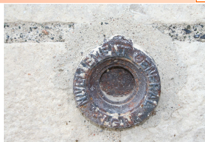
Repère géodésique 44, à gauche de l'escalier de l'église

Les points géodésiques sont des repères cylindriques de nivellement général, des instruments de mesures de l'altitude. Ils sont, en principe, visibles mais peu souvent remarqués bien qu'indispensables à la cartographie de la France. Sur notre commune, il existait quatre repères, mais,