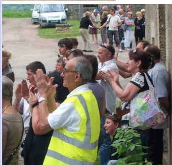
Des spectateurs heureux qui applaudissent chaleureusement l'arrivée des coureurs