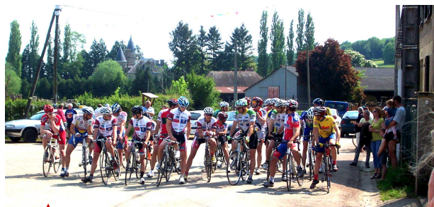
Départ de la course des « grands », devant le Crot de l'Orme. Beaucoup de participants et des spectateurs impatients d'assister au spectacle.