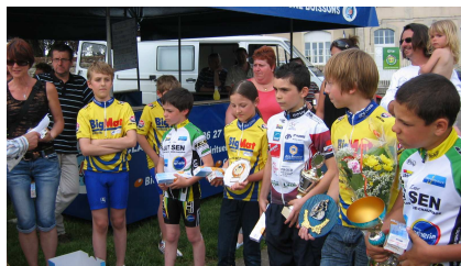
Des filles qui ne manquent pas de courage, présentes au départ mais aussi à l'arrivée sur les podiums. Bravo !