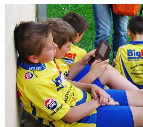
Mais après l'effort ... le réconfort