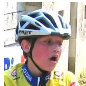
Quel dépassement de soi, cette course !