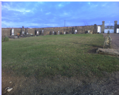
Beaucoup d'espace libre dans notre cimetière

De plus en plus de petites communes aménagent un espace (et le nôtre n'en manque pas !!!) dans leur cimetière afin d'y accueillir un columbarium, voire même un jardin des souvenirs pour y répandre les cendres de leurs défunts. L'investissement, relativement modéré pour un tel projet, se situe aux environs de 3000 à 4000€, pour un columbarium comportant 6 emplacements. Le coût d'un emplacement est généralement de 300 à 600 € pour une durée de 15 ans, et de 500 à 1000 € pour une durée allant de 30 ans à la perpétuité. Si l'on considère le prix de la concession d'un emplacement et le prix de revient de celui-ci, la commune amortit en principe son investissement lorsque tous les emplacements sont réservés. De plus, il est souvent possible d'obtenir des aides notamment du département pour ce type de création. Alors pourquoi ne pas envisager un tel projet d'aménagement de notre cimetière en y ajoutant la réfection du mur d'enceinte et la pose des bordures qui attendent dans un coin depuis longtemps ?