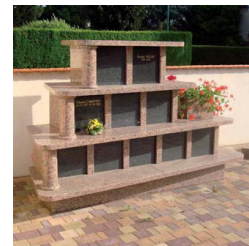
Exemple de columbarium

De plus en plus de petites communes aménagent un espace (et le nôtre n'en manque pas !!!) dans leur cimetière afin d'y accueillir un columbarium, voire même un jardin des souvenirs pour y répandre les cendres de leurs défunts. L'investissement, relativement modéré pour un tel projet, se situe aux environs de 3000 à 4000€, pour un columbarium comportant 6 emplacements. Le coût d'un emplacement est généralement de 300 à 600 € pour une durée de 15 ans, et de 500 à 1000 € pour une durée allant de 30 ans à la perpétuité. Si l'on considère le prix de la concession d'un emplacement et le prix de revient de celui-ci, la commune amortit en principe son investissement lorsque tous les emplacements sont réservés. De plus, il est souvent possible d'obtenir des aides notamment du département pour ce type de création. Alors pourquoi ne pas envisager un tel projet d'aménagement de notre cimetière en y ajoutant la réfection du mur d'enceinte et la pose des bordures qui attendent dans un coin depuis longtemps ?