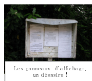
Les panneaux d'affichage, un désastre !