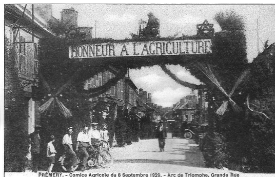
PRÉMERY - Comice Agricole du 8 Septembre 1929. - Arc de Triomphe, Grande Rue

Alors ne manquez pas ce rendez-vous important.