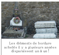
Les éléments de bordure achetés il y a plusieurs années disparaissent un à un !

cependant jamais été entrepris et malheureusement au fil du temps les éléments, laissés là sans surveillance, disparaissent un à un.