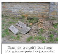
Dans les trottoirs des trous dangereux pour les passants