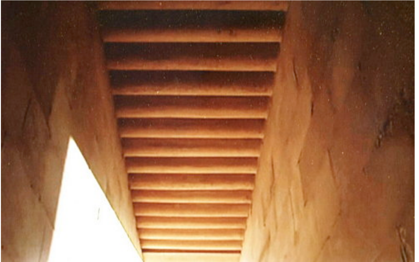
Imitation de rondins de bois dans le couloir d'entrée.