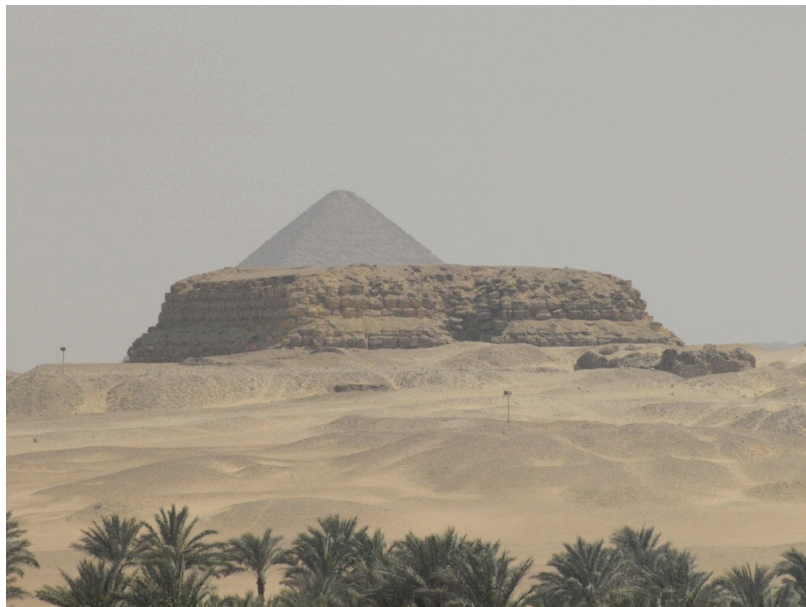
Le monument de nos jours.