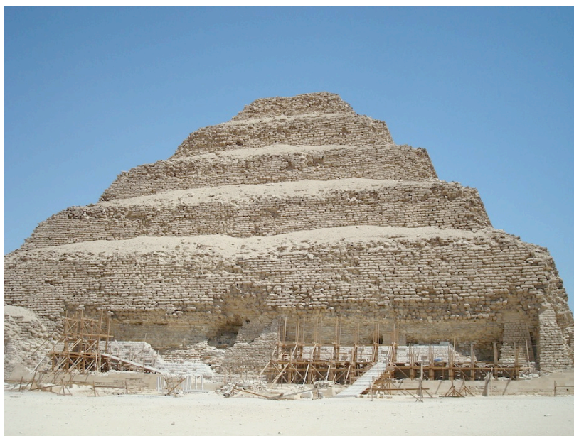
Face Sud de la pyramide.