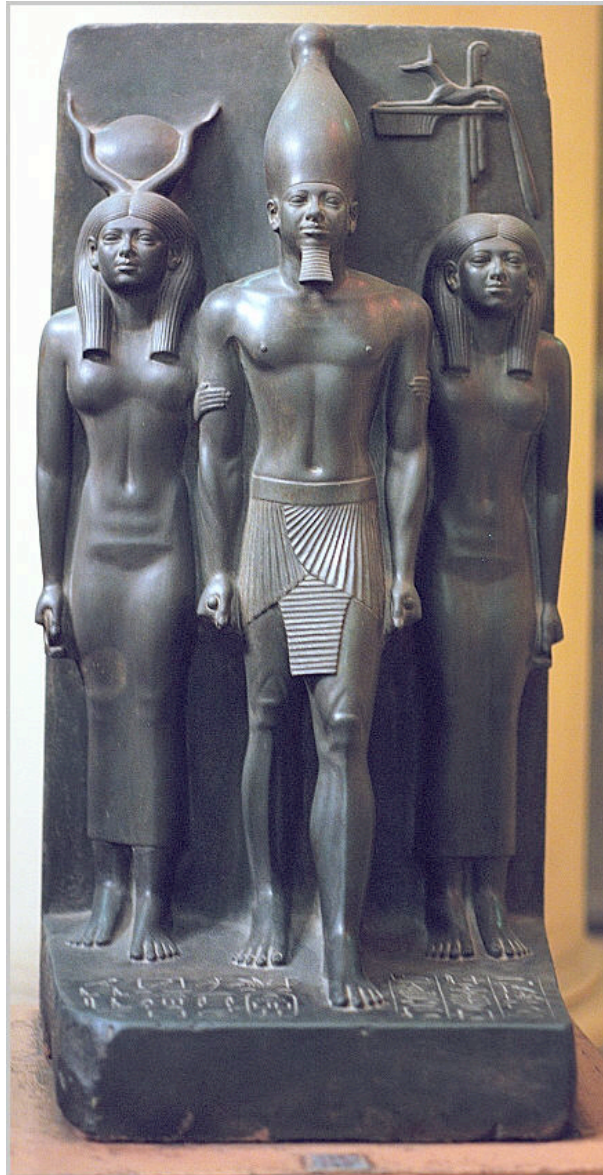
Nome du lièvre.