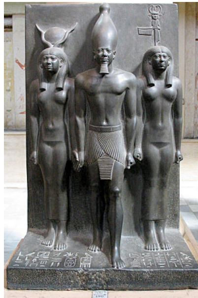
Nome de la Bât.

Le personnage représentant le nome se trouve à gauche du roi et, sur les deux premières du musée du Caire, il a les traits de la reine et a la même taille que la déesse, ils représentent les nomes du chacal et du sceptre des villes de Hardaï et Ouaset. Le troisième personnage de ce même musée est un nain, il est le représentant du nome de la Bât, de la ville de Hout-Sekhem. À noter que sur la triade du nome du chacal, les personnages des bords tiennent le roi par la taille de leur bras intérieur.