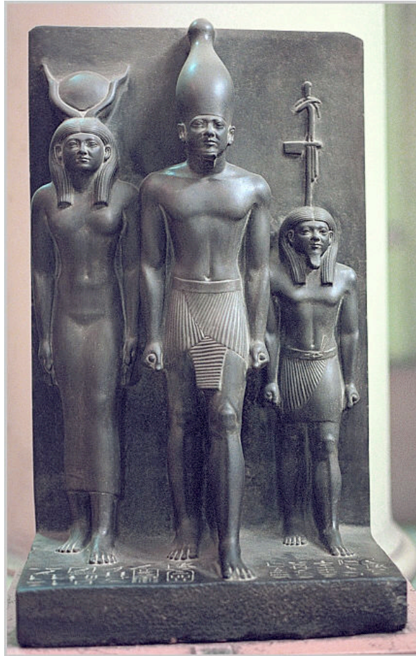
Nome du sceptre.

La triade de Boston est différente des autres, sur celle-ci, le roi est debout à gauche de la déesse qui est assis sur un trône. Le roi est toujours représenté avec la jambe gauche légèrement avancée et porte la couronne blanche. Le nome est celui du lièvre de la ville de Kemnou. Il a les traits de la reine mais est représenté plus petit. La déesse tient le roi de sa main gauche par la taille et lui touche le bras droit de sa main droite.