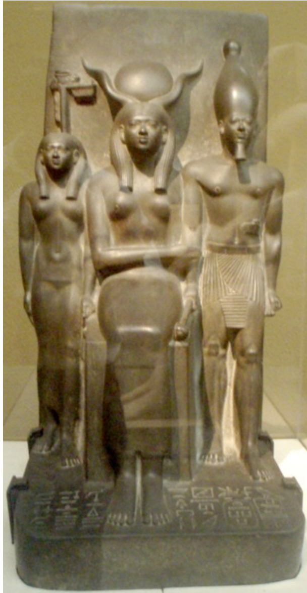
Musée de Boston.