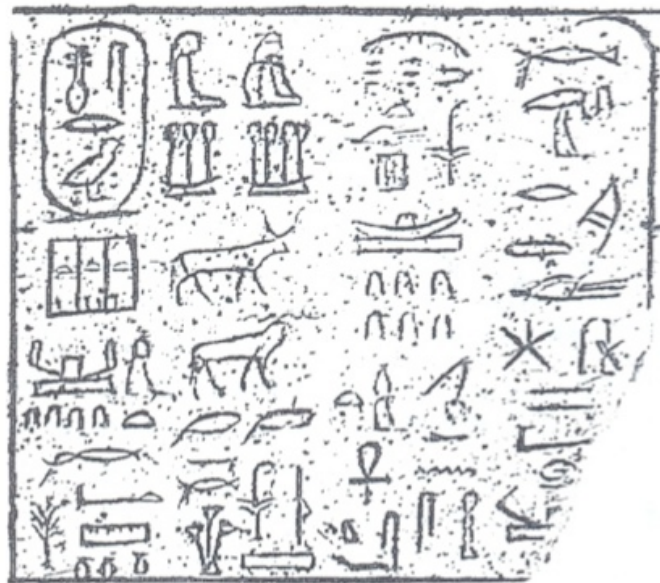
Une campagne en Nubie, annales de Palerme.

Il réorganise l'administration Égyptienne en profondeur. Il divisera le pays en nomes, sortes de provinces régies par un administrateur principal, le nomarque. Il créera le poste de vizir pour son fils Nefremâat, fonction qui existait déjà mais pas aussi officiellement. Les hauts fonctionnaires seront des membres de la famille royale. Son fils Rahhotep sera « superviseur des armées », général en chef et mènera une expédition en Nubie d'où il ramènera 7000 prisonniers hommes et femmes qui iront travailler aux champs et 200000 têtes de bétail. Une autre campagne militaire eut lieu vers la fin de sa vie contre les Libyens, il en ramènera 1100 prisonniers et 13000 têtes de bétail. Bien entendu ces chiffres doivent être largement exagérés, mais sont typiques de la propagande pharaonique.