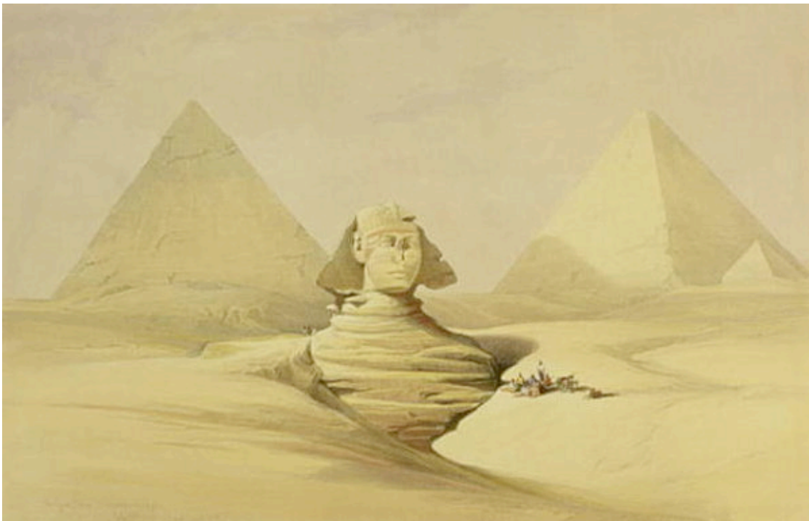
Tel que le voyait David Roberts au 18 ème siècle