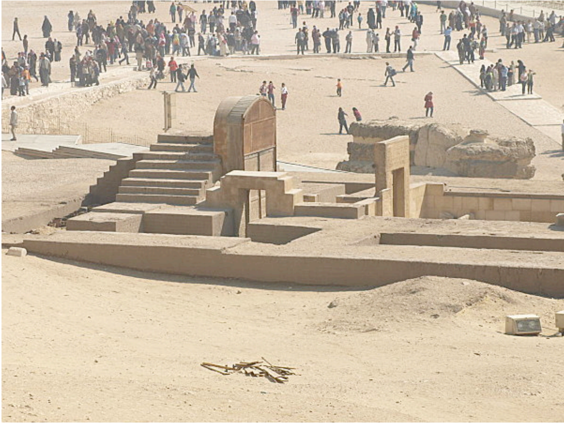
Le temple de la 18ème dynastie.