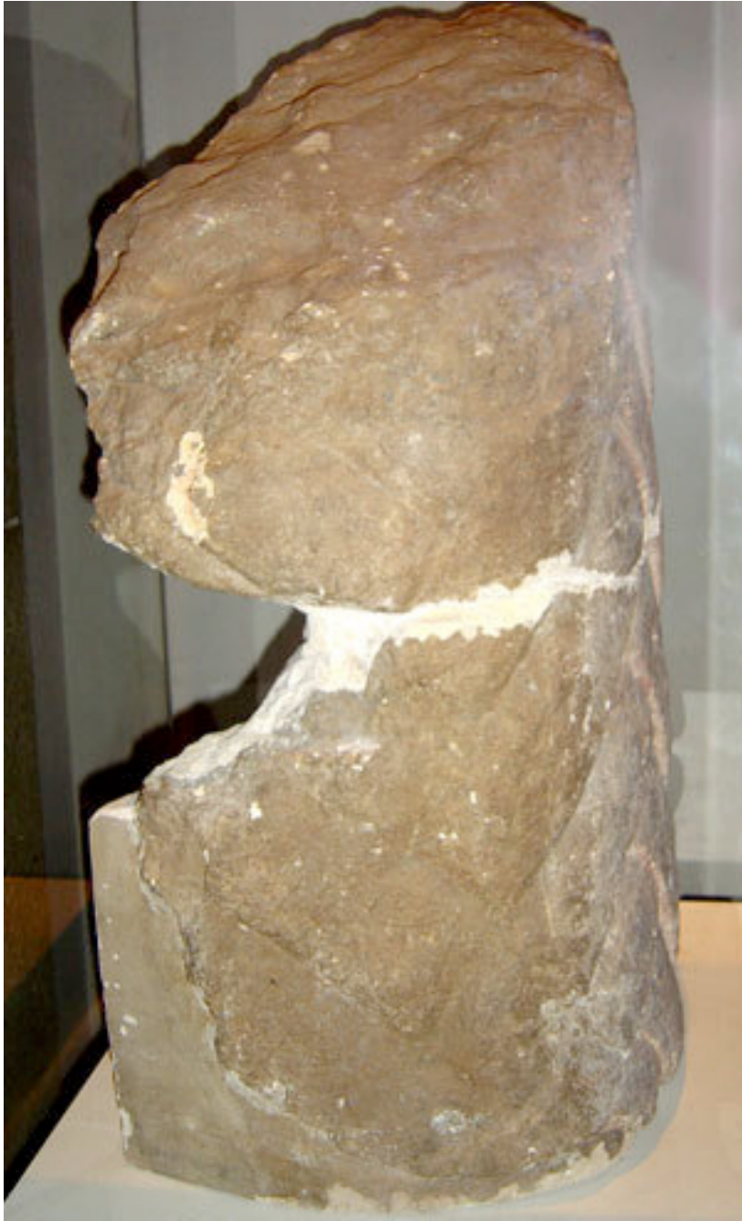
La barbe postiche, au musée de Londres.