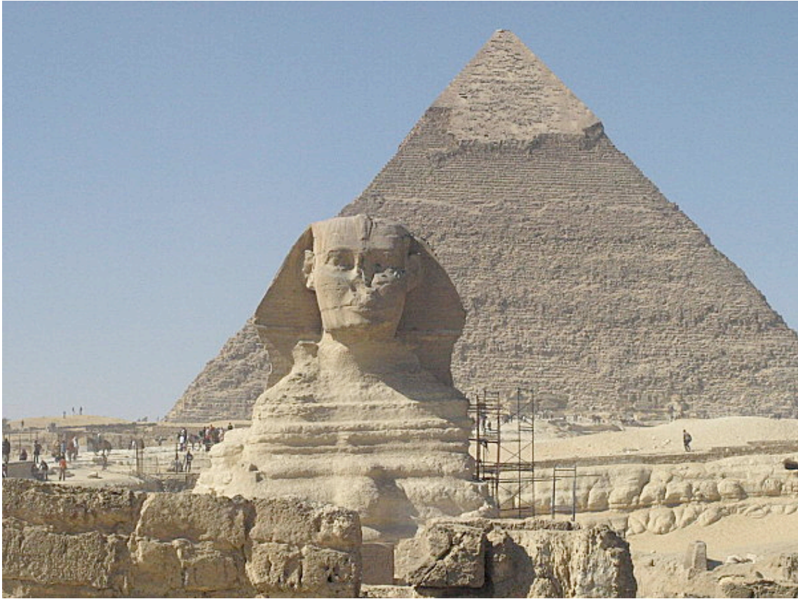
Avec au second plan, la pyramide de Khéphren.