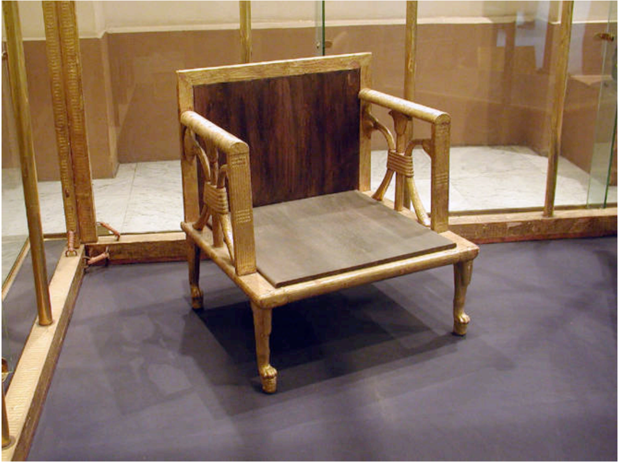
Le fauteuil doré.