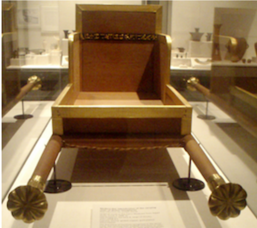
La chaise à porteur