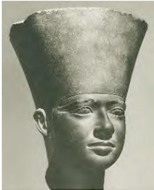
La tête de statue du roi Ouserkaf retrouvée dans le temple.

Le temple n'était pas orienté vers les points cardinaux, mais plutôt vers la cité d'Héliopolis, la ville du culte solaire.