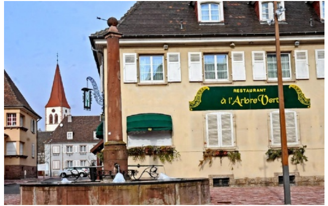
Evelyne et Joël Tournier aimeraient vendre mais garder leur restaurant.

En janvier 2011, ils ont fermé leur hôtel de 19 chambres,