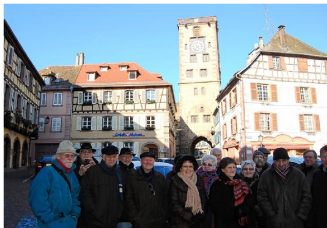
La peinture de l'horloge de la Tour des Bouchers a été rénovée

Un impressionnant échafaudage a été installé durant l'automne à la Tour des Bouchers de Ribeauvillé en vue de la restauration des peintures de l'horloge.