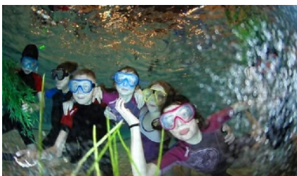
Une rencontre très attendue par les jeunes plongeurs

Le 29 janvier, le club de plongée Aqua-Team Kayserberg, a organisé à l'espace nautique Arc-en-Ciel des jeux subaquatiques en piscine.