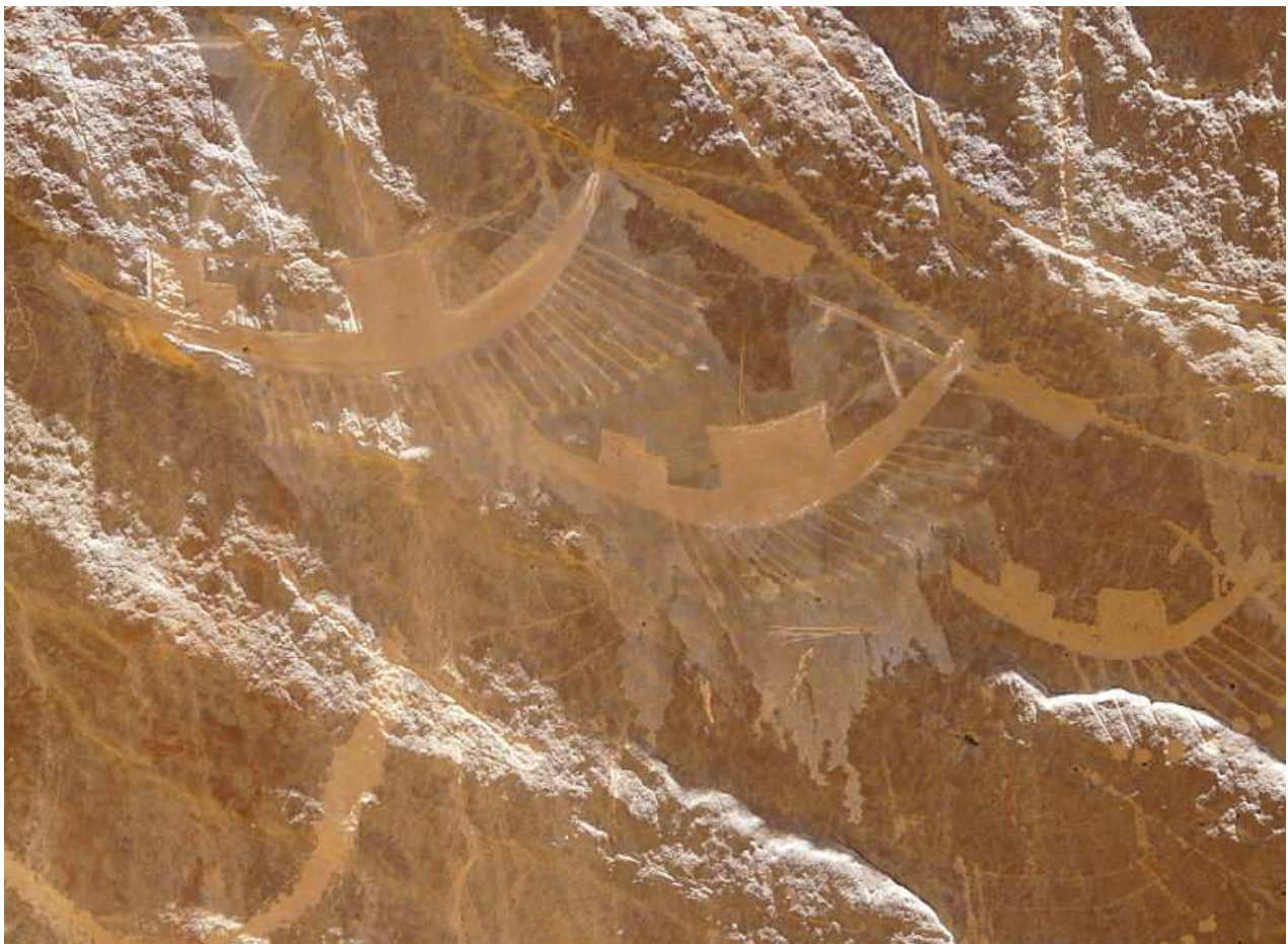
Gebel Silsileh... Pétroglyphes !