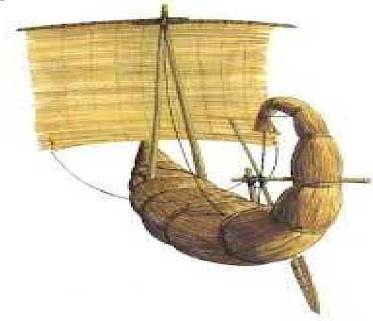
3 500 ans avant notre ère... Source