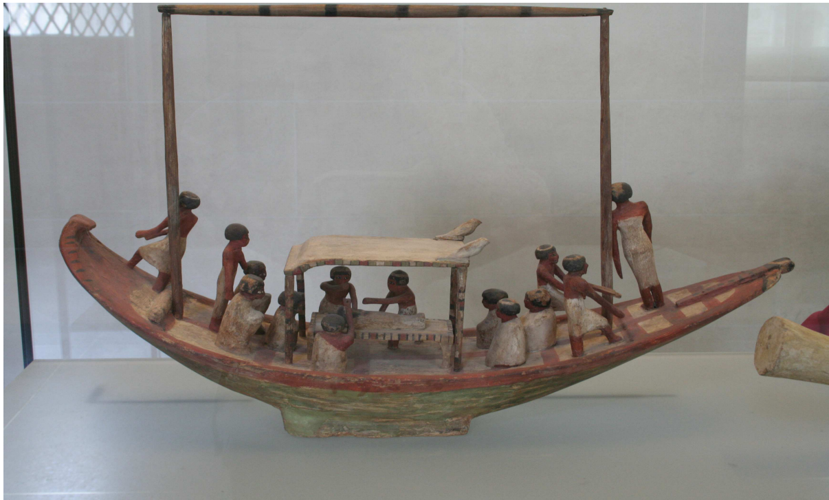
Bois peint... 2 000 ans avant JC. Musée du Louvre, salle n° 3, Sully, Rez-de-chaussée . E 17111.