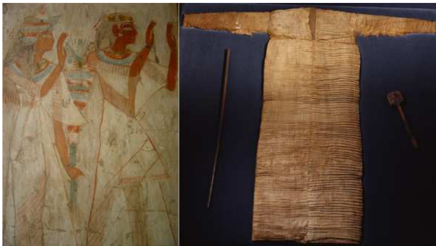
Hypogée de Nefrenpet, TT178...