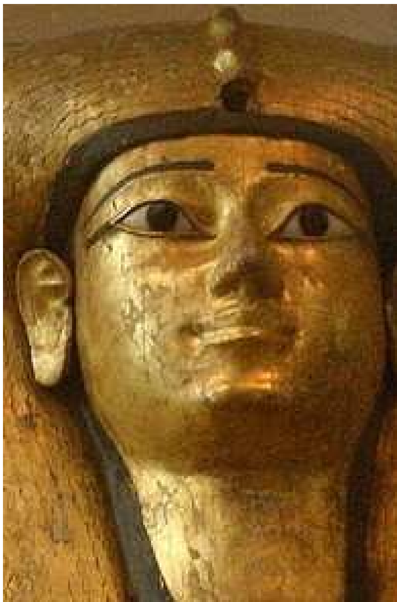
Masque du sarcophage de la reine Iâh-Hotep ou Ahhote... Thèbes. Musée du Caire.