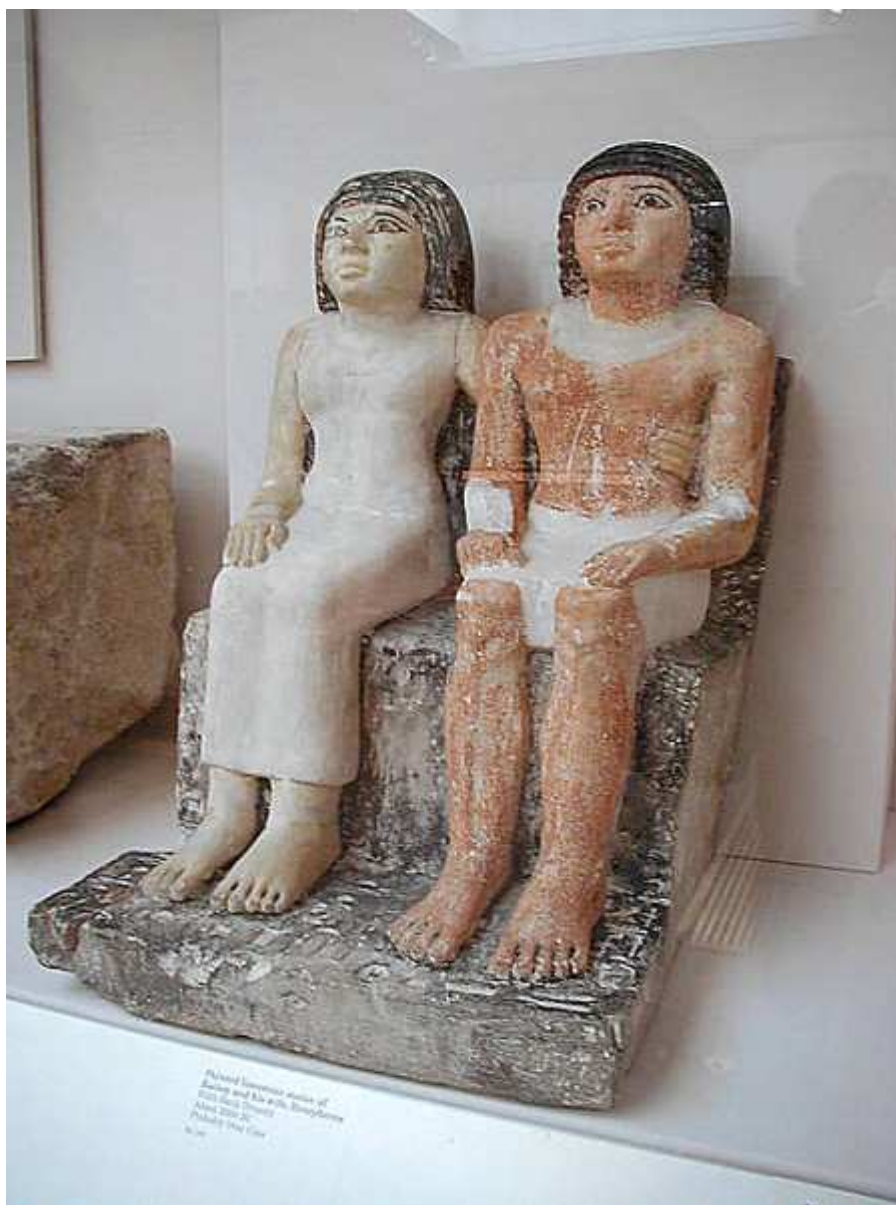
Kaitep et sa Femme Hetepheres.