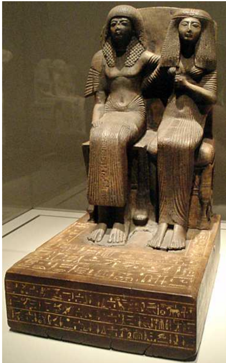
Amenopé ainsi que sa Femme...