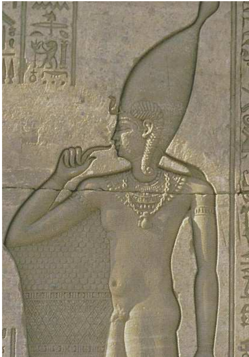
Temple d'Hathor à Dendérah, bas-relief...