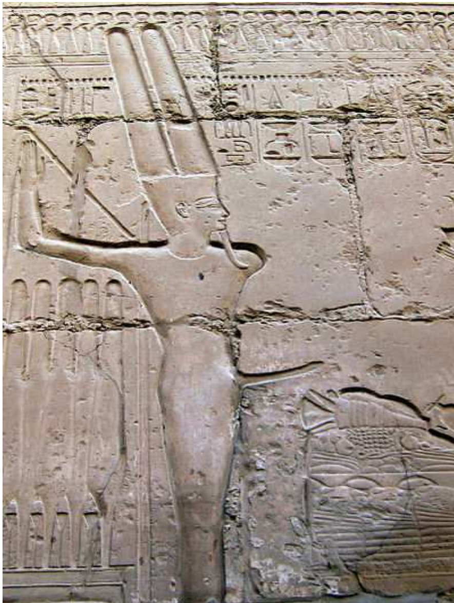
Le nètèr Min.