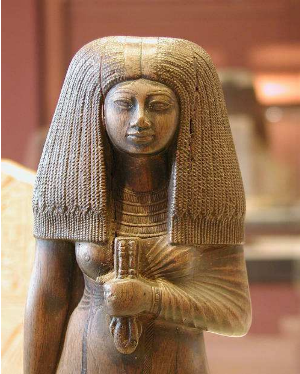
Tuya... 18e dynastie. Louvre.