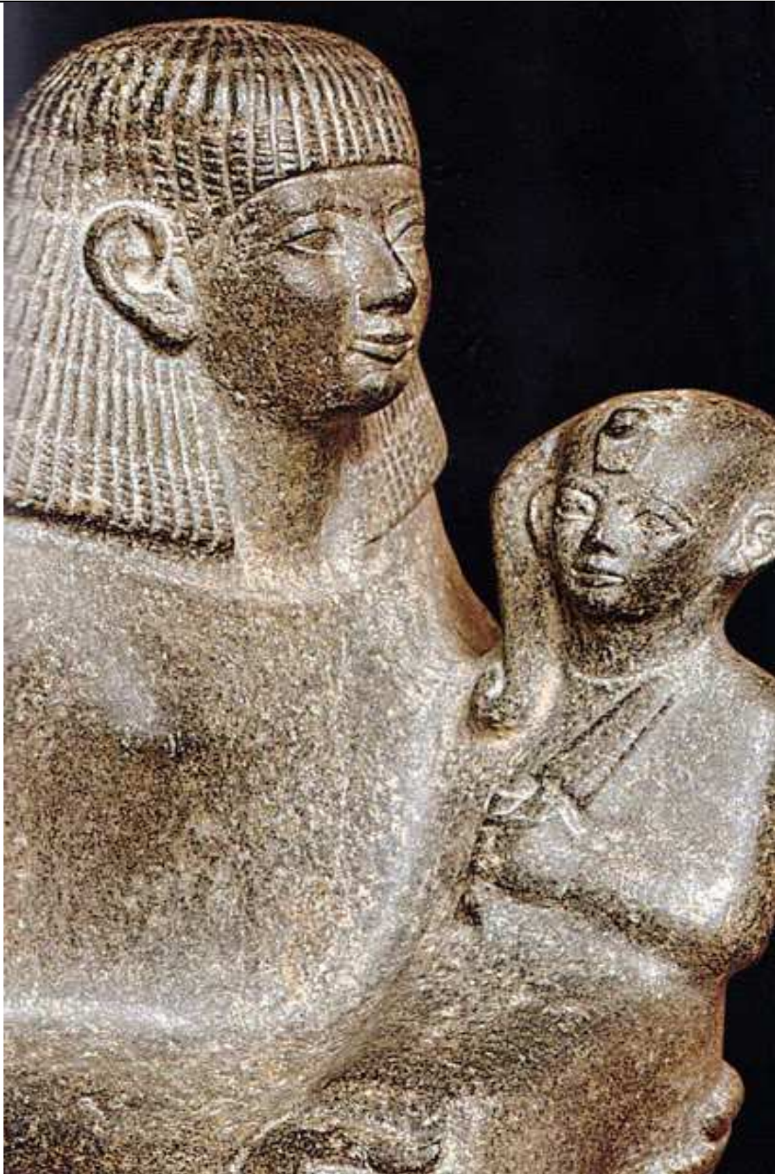
Sénènmut portant la princesse Néfèrourê...

Dans l'Égypte ancienne, la tendresse ne fut pas l'apanage des femmes... Senenmout, architecte et peut-être amant du pharaon Hatchepsout, portant sa fille dans ses bras ! Chicago au Field Museum.