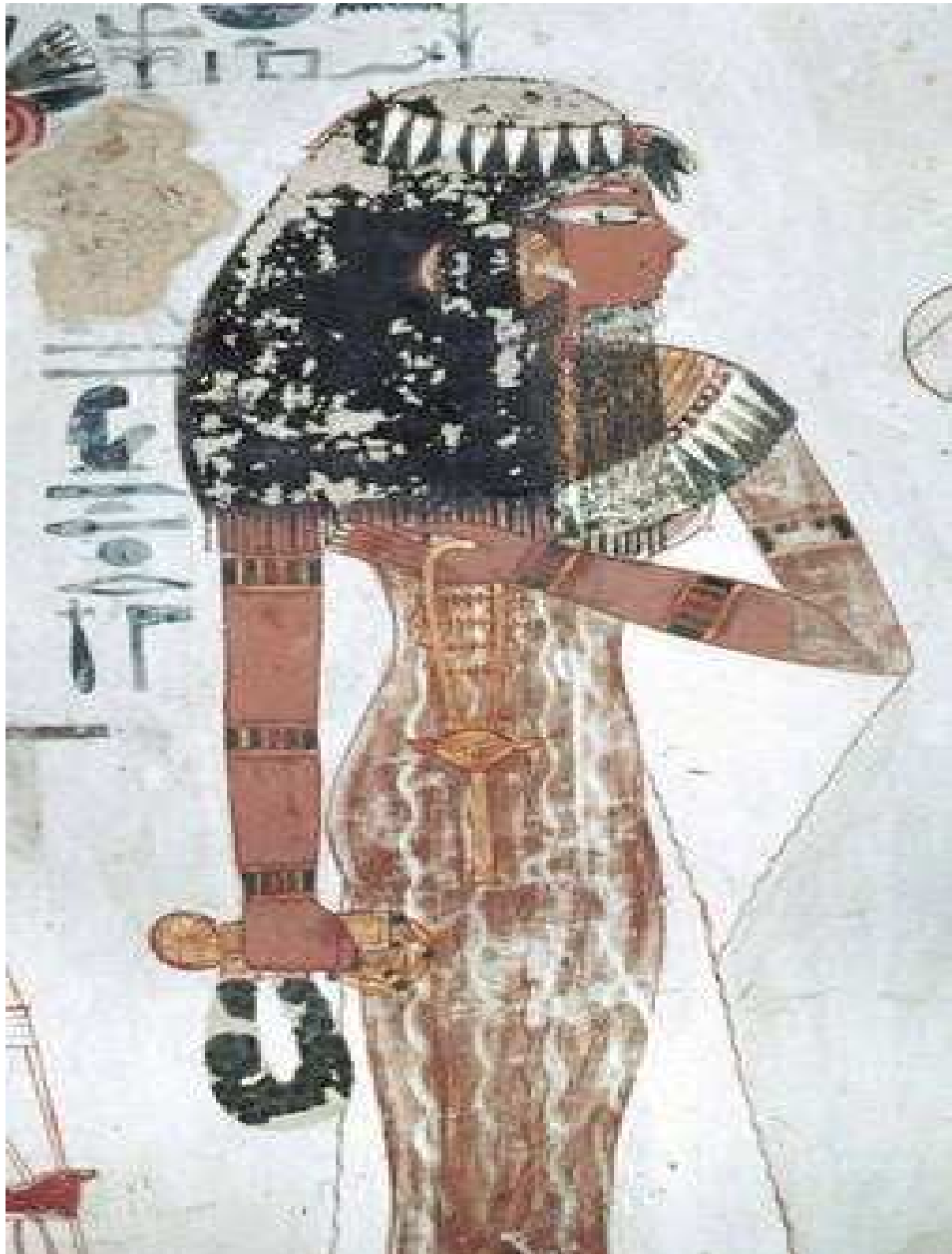
Magnifique peinture, la femme et l'épouse de Sennefer... Vous avez dit robe transparente !