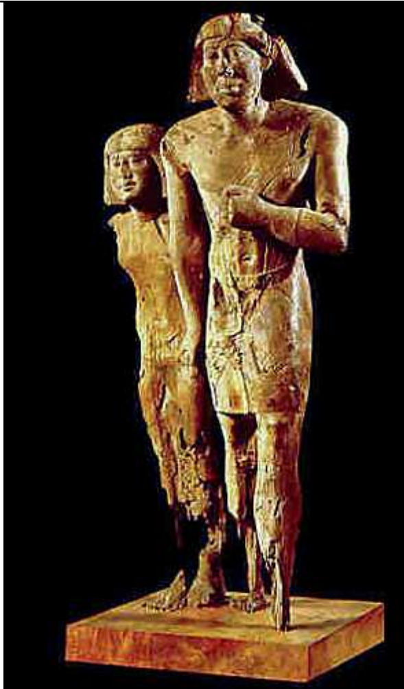
Rahotep et Nofret. Louvre.