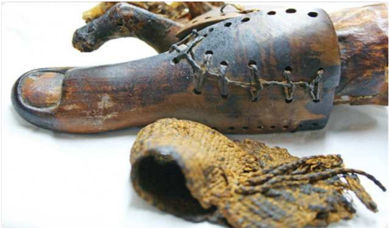
Musée du Caire.

Je subodore même, que les médecins, certains du moins et particulièrement ceux de haute lignée, devaient assister aux embaumements afin d'accéder aux organes !