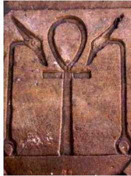
Croix de vie temple d'Horus à Edfou...

"Je suis tout à l'Égypte, elle est tout pour moi."