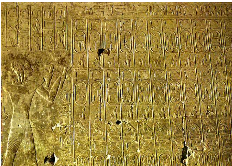
Liste des cartouches des pharaons dans le temple de Séthi I. 19e dynastie... Abydos.