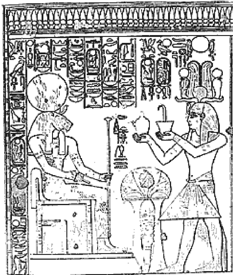
Pakhet est coiffée du globe solaire ! Séthi I offrait ici une libation et une fumigation à la netjeret Pakhet... P3h t.