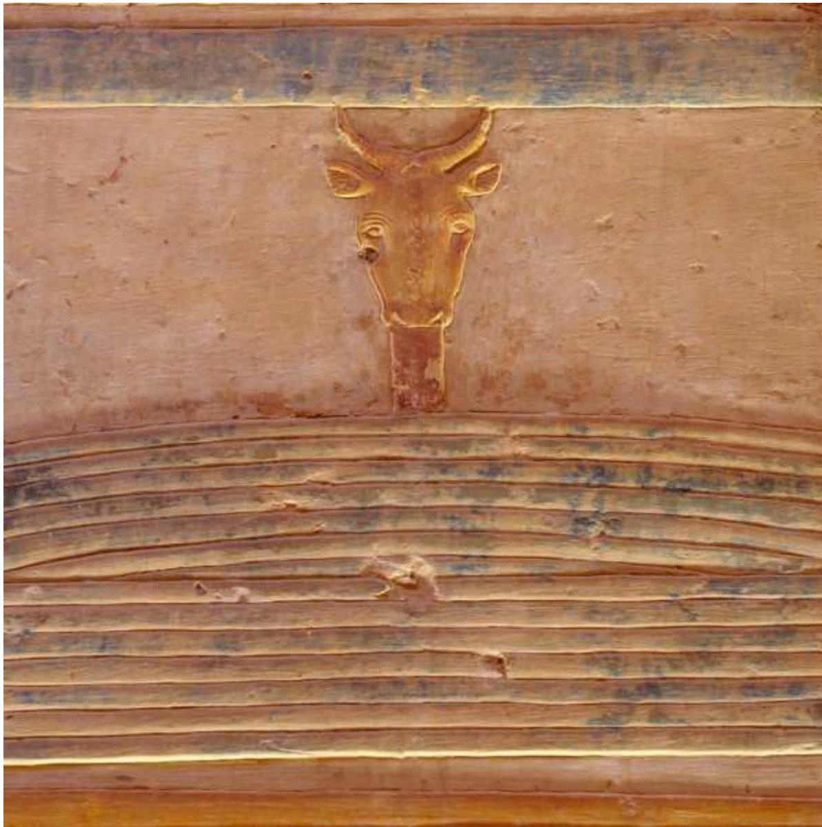
Détail du mur de la salle des colonnades du complexe d'Osiris... Dans le temple du pharaon Seti I. Abydos.