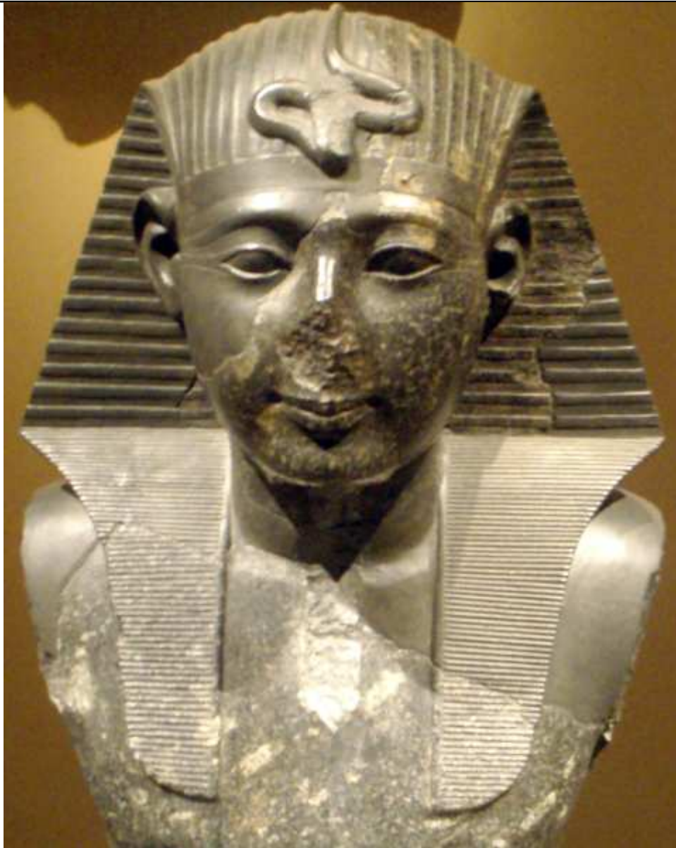
Statue du pharaon Seti I...