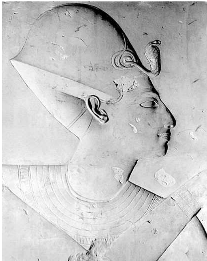
Sétî I.