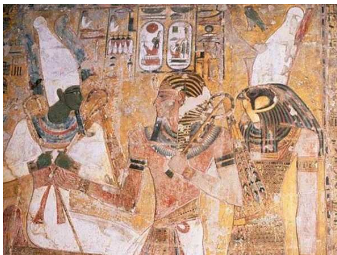
Horus menant le pharaon Sethi I vers Osiris...

Vous pourrez y découvrir quelques salles qui semblent avoir été consacrées à Ramsès I !