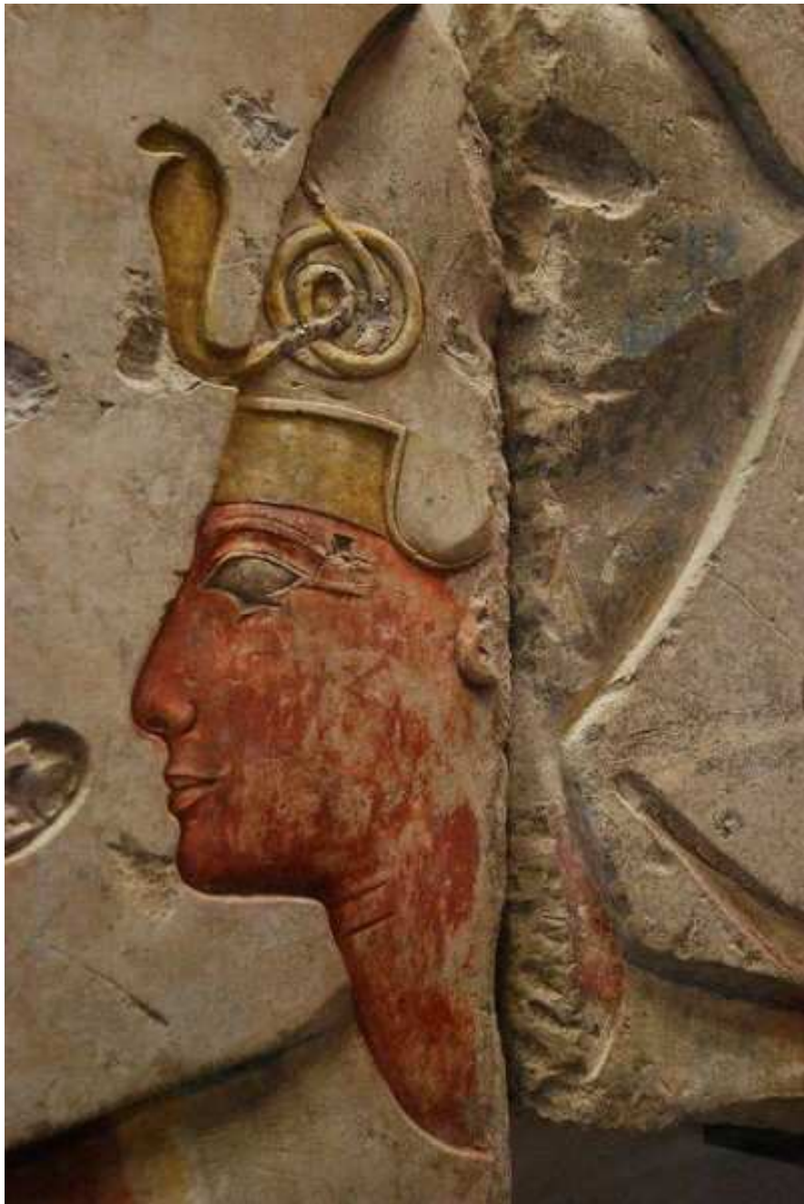
Détail d'un relief d'Abydos, celui du fils du pharaon Séthi I ! Ramsès II !