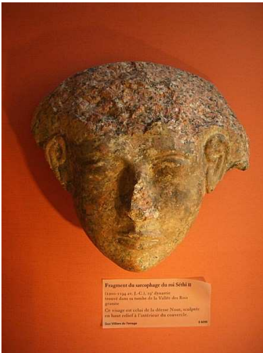
Fragment d'un des sarcophages externes du pharaon Sethi II... Musée du Louvre.