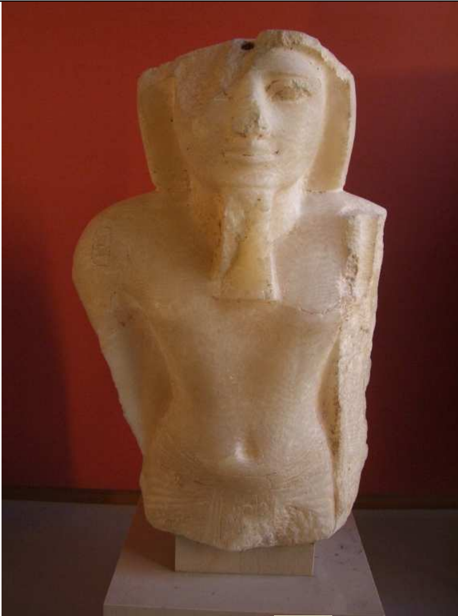
Buste fragmentaire d'une statue en albâtre de Mérenptah . Le pharaon est figuré debout et devait certainement tenir une enseigne divine ! Musée du Louvre.