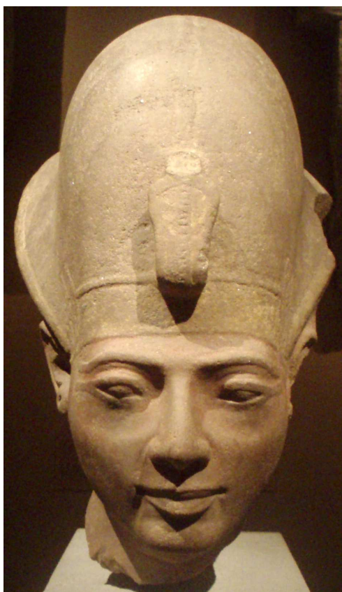
Tête d'une statue d' Amenmes trouvée à Karnak et aujourd'hui conservée au Metropolitan Museum of Art de New York.

→ Article n°3 : ce vizir qui bafoua les usages !