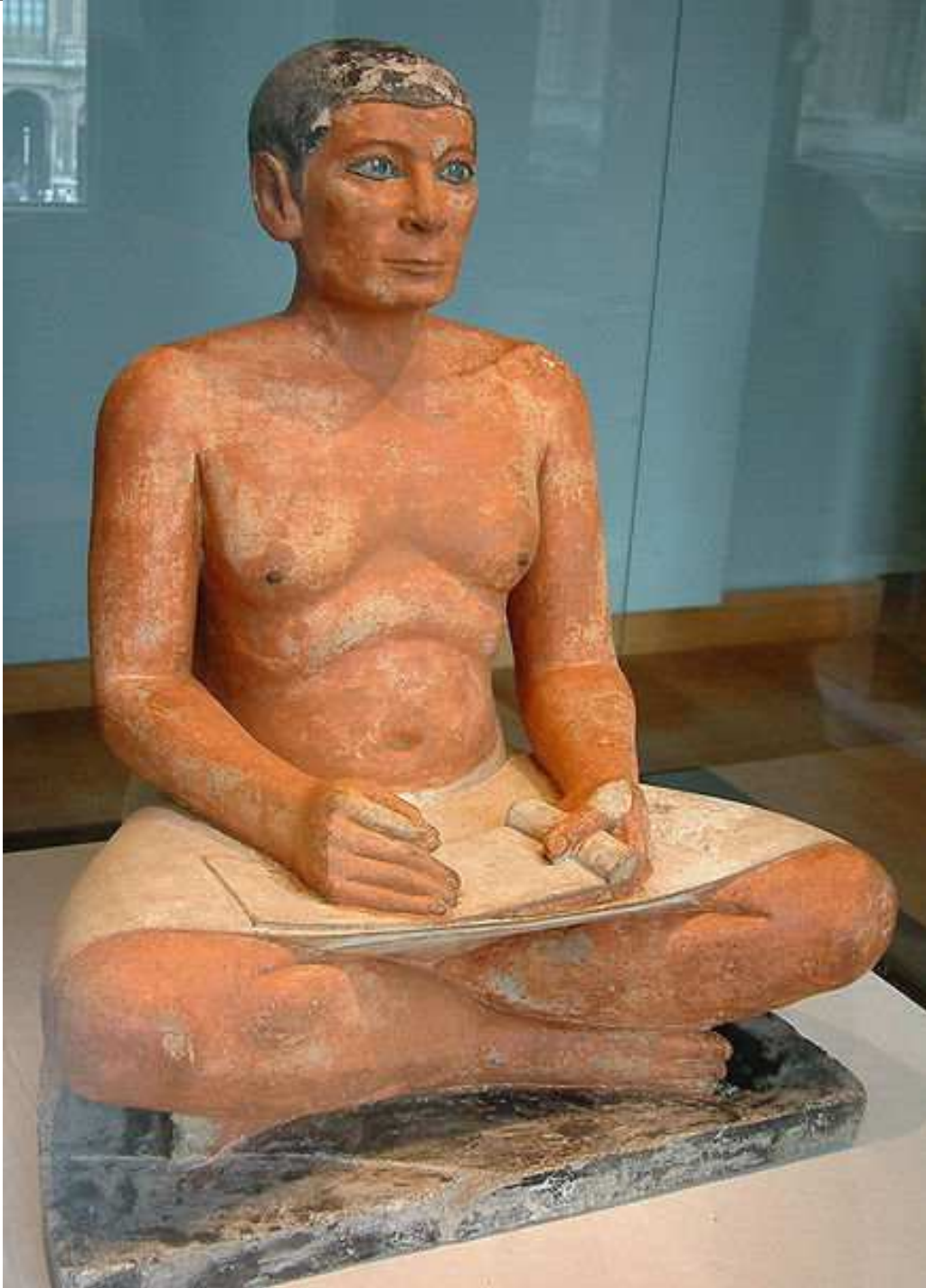
Le scribe accroupi. Musée du Louvre. Scribe de Saqqarah.