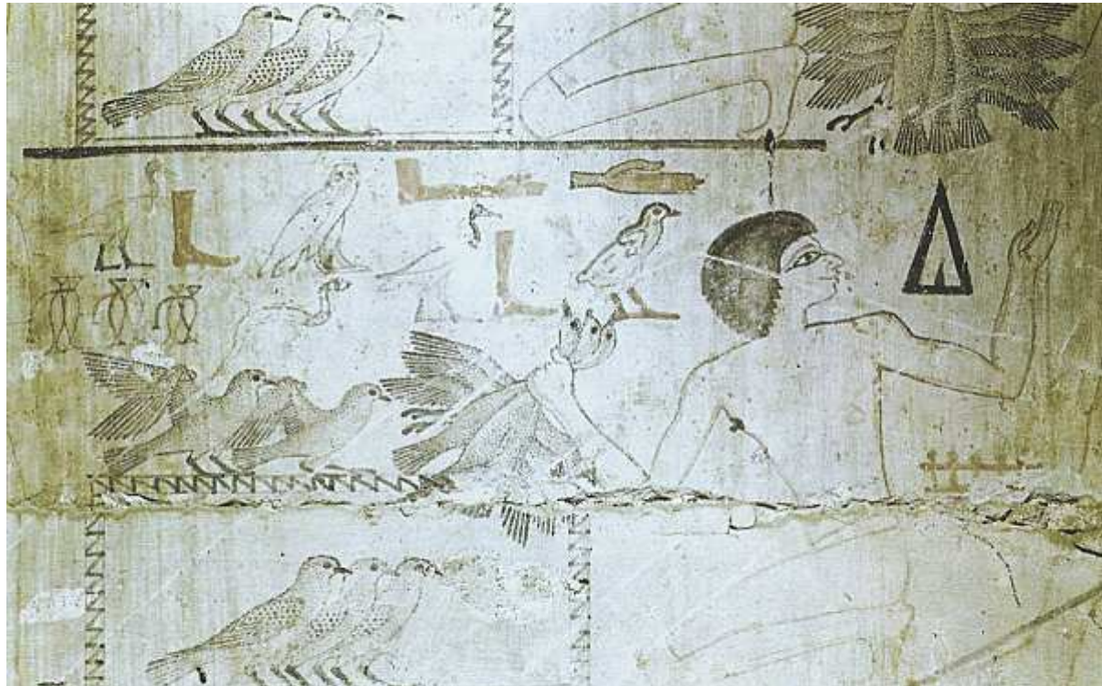
Scène de chasse aux oiseaux... Peinture murale de la 5e dynastie. Saqqarah. Mastaba de Neferherenptah.

Mais avant tout, ce fut le sport favori de pharaon !