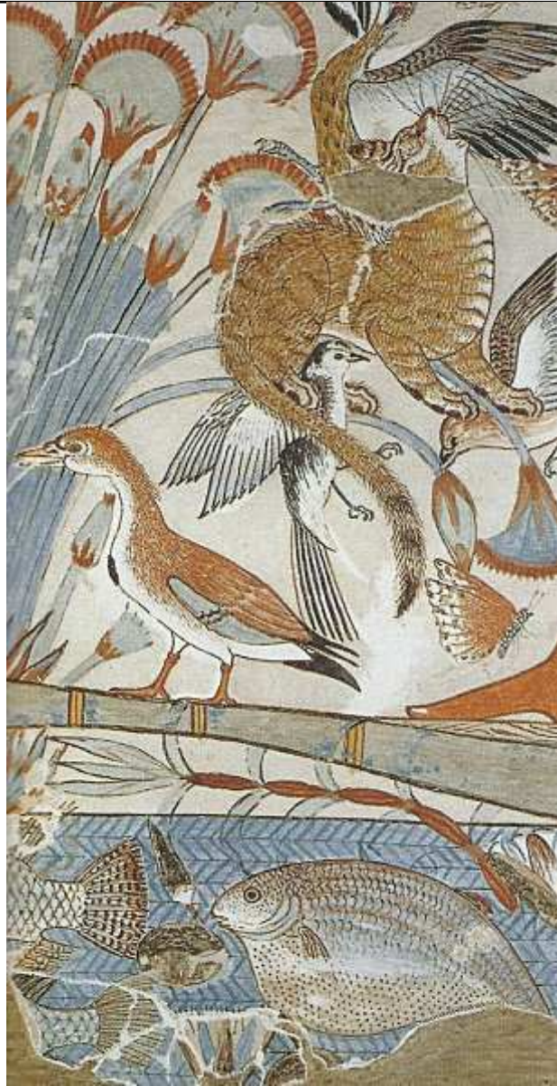
Peinture murale représentant une chasse au gibier d'eau dans les marécages. Voici une copie d'un original par Nina M. Davies. Bibliothèques du Louvre.