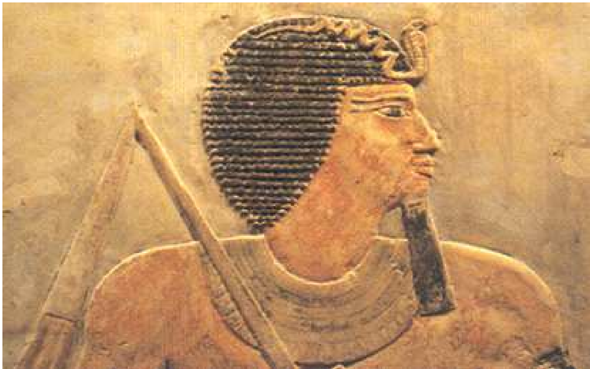
Linteau : el-Licht. Metropolitan Museum.