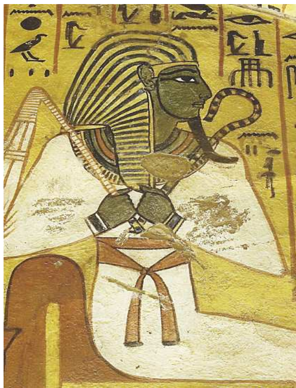
Hypogée de Peshedu.