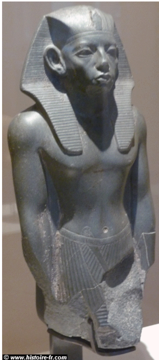
Statue d'Amenemhat III.