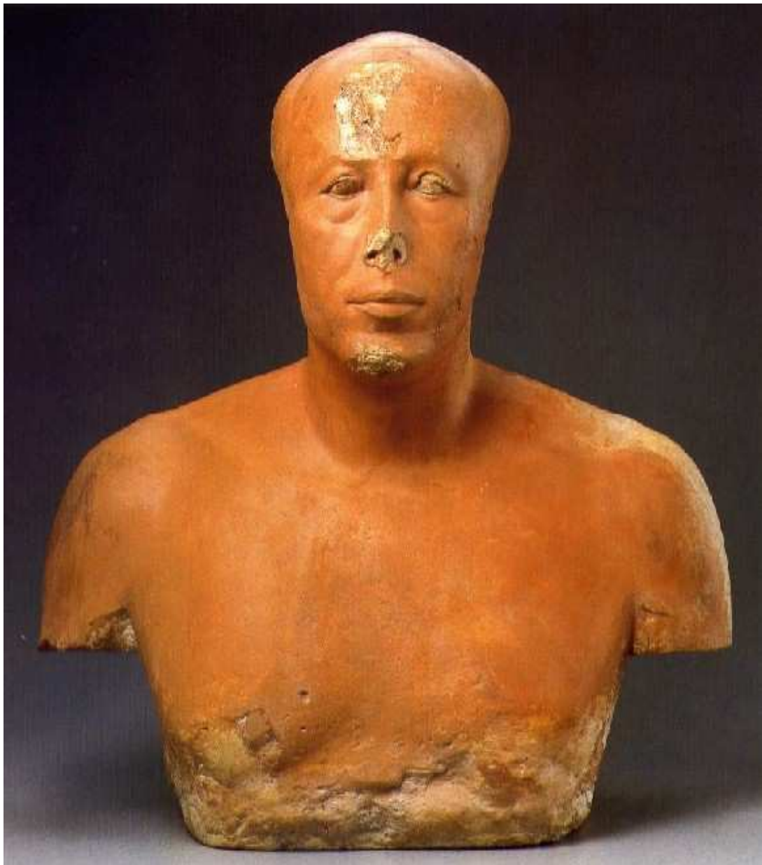
L'ancien Empire égyptien, 4e dynastie ! Calcaire et buste polychrome en plâtre teinté... Le prince Ankhaf.