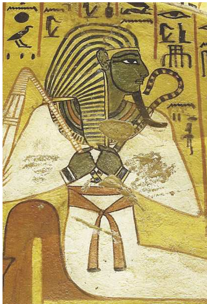
Hypogée de Peshedu.