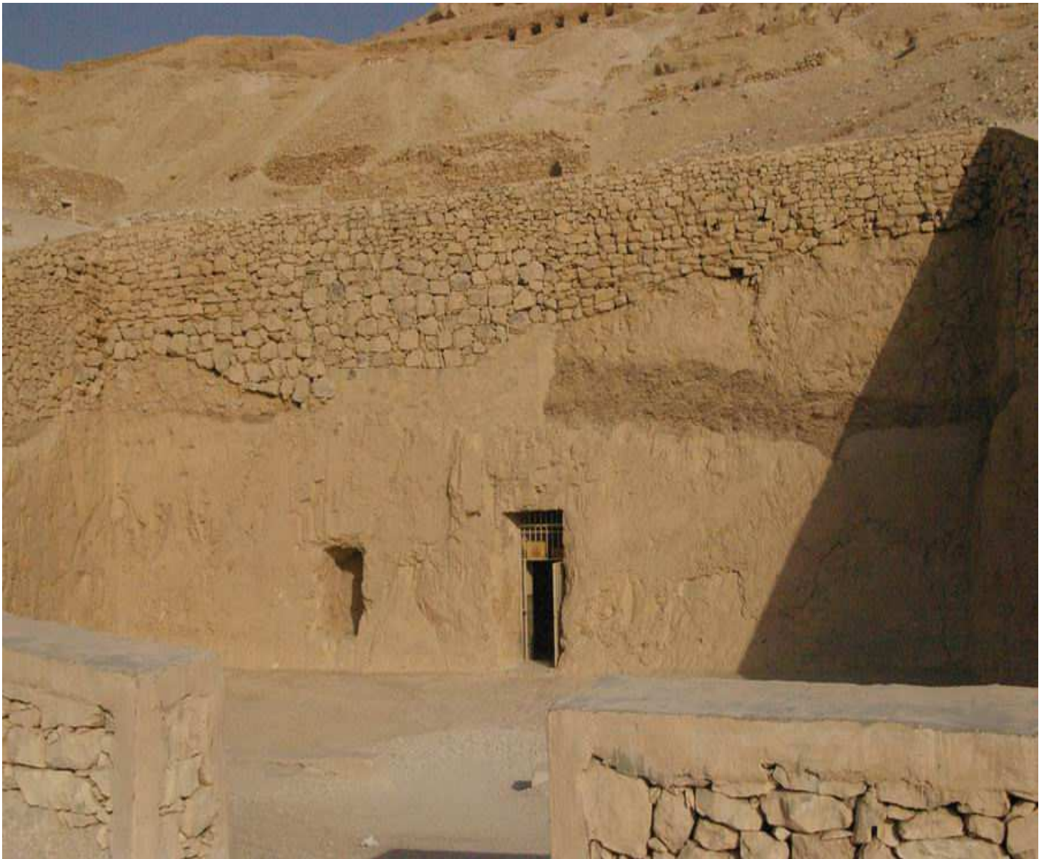
La cour et l'entrée de la tombe du vizir Rekhmirê !