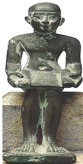
Bronze d'Imhotep Époque Ptolémaïque. Musée Condé. Chantilly.